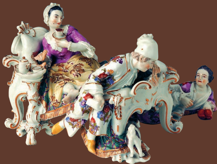
Der entdeckte Galan, Meißen um 1770 Museen der Stadt Bamberg Sammlung Ludwig