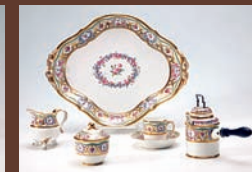
Hetjens-Museum Düsseldorf, Schokoladenkanne, Schokoladenservice