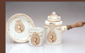
um 1790, Porzellanmanufaktur FÜRSTENBERG, Museum im Schloss

Die Vorträge finden im Sitzungssaal des Aachener Rathauses statt. Im Anschluss daran kann die Ausstellung „Süße Versuchung - Vom Kakao zur Schokolade“ im Rahmen einer Sonderöffnung bis 21 Uhr besucht werden.