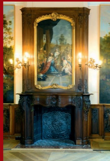
Aachener Holzkamin, 18. Jahrhundert, Couven-Museum (Foto: Anne Gold, Aachen) Stukkierter Kamin von Pietro Nicolo Gagini, 1778 (Foto: Anne Gold, Aachen)

Die warme Behausung ist in unseren Breiten eine der elementaren Voraussetzungen des Wohnens. Zum Heizen dienten unseren Vorfahren in den vergangenen Jahrhunderten nach den offenen Feuerstellen die Kamine und geschlossenen Öfen aus Gusseisen oder Keramik. Die Entwicklung dieser häuslichen Wärmespender war bestimmt von funktionalen Verbesserungen, aber auch vom wandelbaren Zeitgeschmack. Denn die in wohlhabenden Häusern häufig kunstreich gestalteten Öfen und Kaminensembles waren nicht allein zweckgebundenes Inventar, sondern noch dazu optischer Akzent des Innenraums. Prunkvolle Kamine des Aachen-Lütticher Rokoko, zierliche Zimmeröfen des frühen 19. Jahrhunderts, elegante Ofenschirme und schimmernde Messing-Accessoires offenbaren sich im Couven-Museum als ebenso funktionale wie repräsentative Elemente historischer Wohnraumgestaltung. Von der gusseisernen „Kochmaschine“ über Bettpfanne und Bügeleisen reichen die Beispiele der nützlich-unehrlichen Alltagsgegenstände in der Geschichte der häuslichen Wärmetechnik. Sie lockt den Betrachter mit dem originalgetreuen Puppenherd und seinem Zubehör bis in die Welt des kindlichen Spiels. Besondere Höhepunkte bilden unter den Gebrauchsgegenständen die frühneuzeitlichen Kühl- und Wärmekugeln, kostbare Utensilien für Gesundheit und Wohlbefinden, die zumeist dem fürstlichen oder kirchlich-klösterlichen Besitz entstammten.