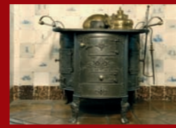
Kochmaschine, ca. 1860, Couven-Museum

Erstmals werden auch ausgewählte Exemplare der erst jüngst erschlossenen Sammlung von Ofenkacheln aus Renaissance und Barock aus dem Aachener Suermondt-Ludwig-Museum ausgestellt. Sie bieten einen eindrucksvollen Überblick über die Erzeugnisse der großen Zentren mitteleuropäischer Hafnerkunst. Einzelne spektakuläre Motive wie das Menschenpaar im Drachenbaum zeigen die schöpferische Bandbreite des Kunsthandwerks. Fünf Kachelöfen in miniature lassen Ofenarchitekturen und Kacheltypen erstaunlich detailgetreu erkennen. Von den Kachelbäckern wohl als Vorführmodelle für eine finanzkräftige Käuferschicht erstellt, verfügen sie heute über einen hohen historischen Quellenwert. Neben der Kunstgeschichte der Ofenkeramik, des Kunsteisengusses und der bürgerlichen Innenraumgestaltung werden insbesondere die technikgeschichtlichen Aspekte des Ofen- und Kaminbaus bis zu den Anfängen der Zentralheizung beleuchtet. Sie setzte sich im 20. Jahrhundert langsam gegen die Einzelöfen durch. Mit Warmwasser oder Wasserdampf durch Rohrleitungen beschickt, finden gusseiserne Radiatoren zunächst in den Wohnräumen des gehobenen Bürgertums Aufstellung. Die zentrale Warmluftheizung temperiert über Luftkanäle und Zuluftklappen von nun an ganze Kirchen.