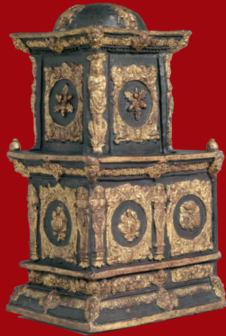
Ofenmodell, 17. Jahrhundert Germanisches Nationalmuseum Nürnberg

Die warme Behausung ist in unseren Breiten eine der elementaren Voraussetzungen des Wohnens. Zum Heizen dienten unseren Vorfahren in den vergangenen Jahrhunderten nach den offenen Feuerstellen die Kamine und geschlossenen Öfen aus Gusseisen oder Keramik. Die Entwicklung dieser häuslichen Wärmespender war bestimmt von funktionalen Verbesserungen, aber auch vom wandelbaren Zeitgeschmack. Denn die in wohlhabenden Häusern häufig kunstreich gestalteten Öfen und Kaminensembles waren nicht allein zweckgebundenes Inventar, sondern noch dazu optischer Akzent des Innenraums. Prunkvolle Kamine des Aachen-Lütticher Rokoko, zierliche Zimmeröfen des frühen 19. Jahrhunderts, elegante Ofenschirme und schimmernde Messing-Accessoires offenbaren sich im Couven-Museum als ebenso funktionale wie repräsentative Elemente historischer Wohnraumgestaltung. Von der gusseisernen „Kochmaschine“ über Bettpfanne und Bügeleisen reichen die Beispiele der nützlich-unehrlichen Alltagsgegenstände in der Geschichte der häuslichen Wärmetechnik. Sie lockt den Betrachter mit dem originalgetreuen Puppenherd und seinem Zubehör bis in die Welt des kindlichen Spiels. Besondere Höhepunkte bilden unter den Gebrauchsgegenständen die frühneuzeitlichen Kühl- und Wärmekugeln, kostbare Utensilien für Gesundheit und Wohlbefinden, die zumeist dem fürstlichen oder kirchlich-klösterlichen Besitz entstammten.