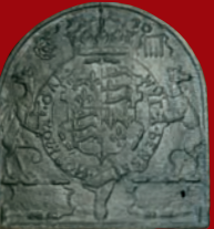
Gusseiserne Ofenplatte mit königlich-englischem Wappen, dat. 1570 Couven-Museum